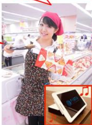
10インチimpactTV+バッテリー

※対象店舗の内訳平均販売額 ※ファッションメーカーへのヒアリングでは、連年1.3~2.5倍の増加